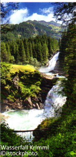
Wasserfall Krimml