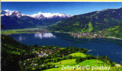
Zeller See