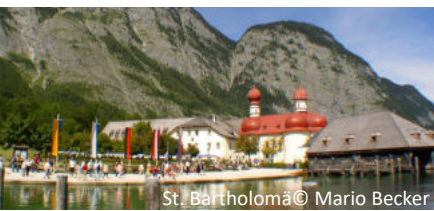
St. Bartholomä © Mario Becker