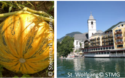
St. Wolfgang