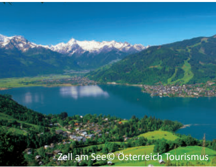
Zell am See